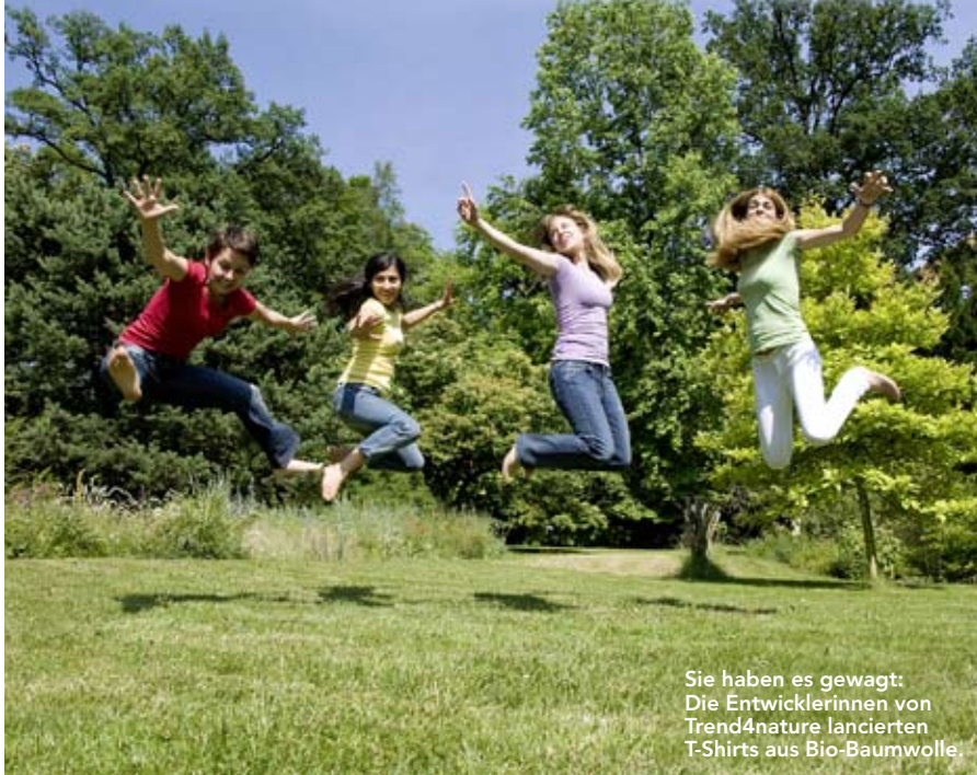
Sie haben es gewagt: Die Entwicklerinnen von Trend4nature lancierten T-Shirts aus Bio-Baumwolle.